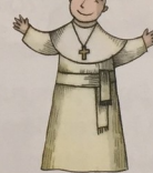
Juan Pablo II (1978-2005)